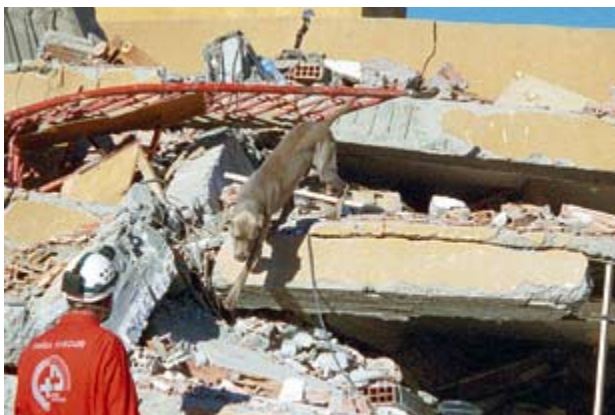
Algérie 2003

Grâce au travail de leur propriétaire, certains chiens sont même reconnus d'utilité publique ( chiens de catastrophe, chiens d'avalanche, chiens sanitaires, chiens d'aveugle, chiens de police, chiens d'assistance pour handicapés ).