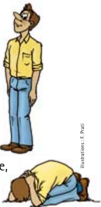
illustrations : F. Prati

Le chien se désintéresse et s'éloigne d'une personne silencieuse et immobile. Toute agitation attire son attention.